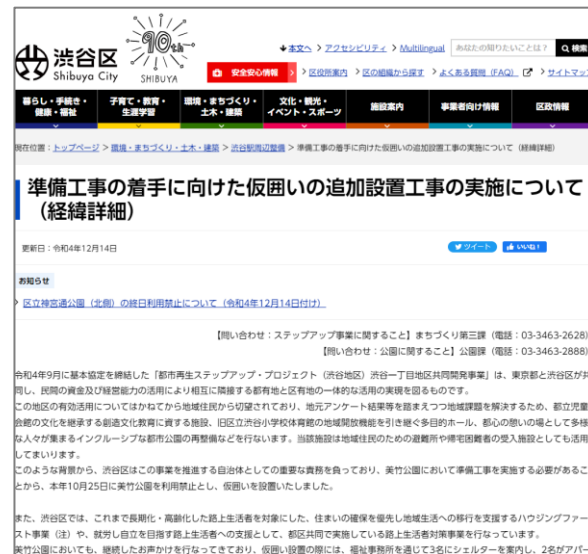
美竹公園の再開発着手にあたっての渋谷区の説明

※渋谷区の支援：公園に寝泊まりさせるのではなく、社会復帰を支援することが自治体の責務との考え