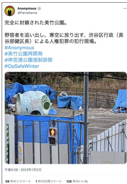
渋谷区の対応を非難する Parrattarna のツイート