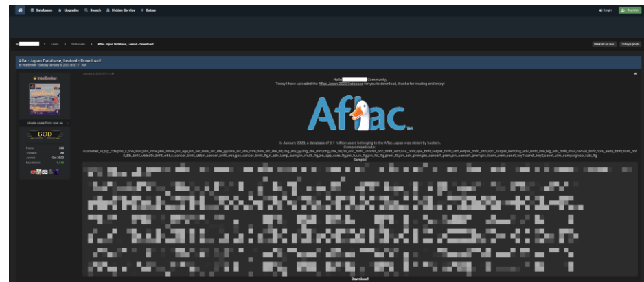
ハッカー掲示板に投稿されたチューリッヒ、アフラックのデータベースの暴露 サンプルとして一部個人データが掲載されているため、該当部分を加工