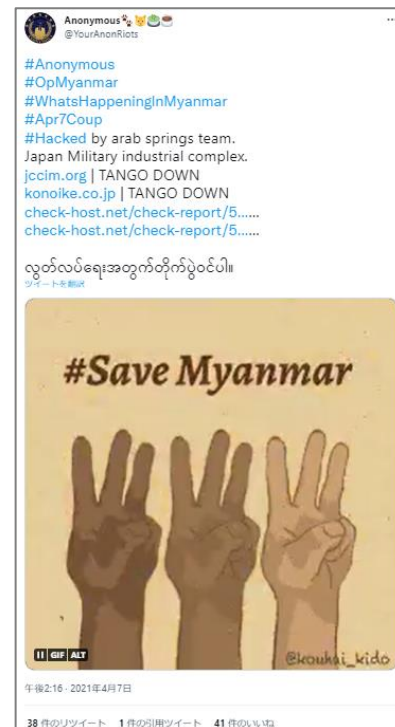
左：#OpSafeWinter のハッシュタグを付けた YourAnonRiots のツイート 右：YourAnonRiots がミャンマー日本商工会議所及び鴻池組のWebサイトをダウンさせたと主張するツイート